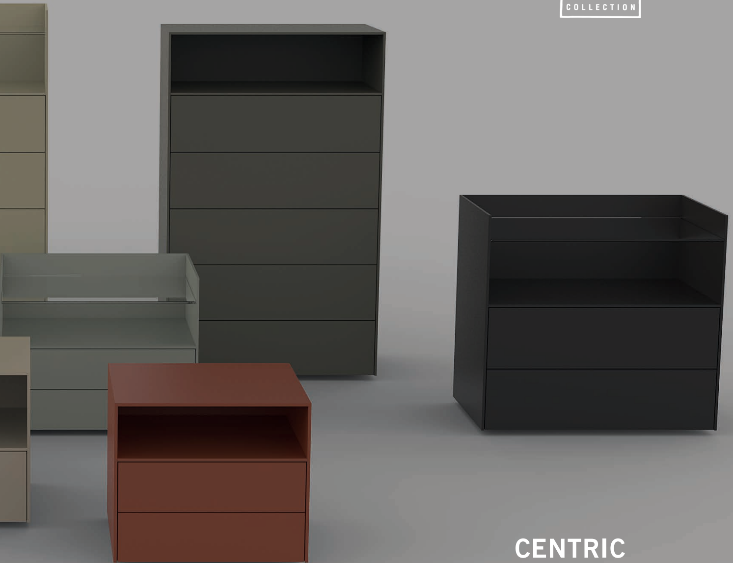
CENTRIC Kommoden cabinets