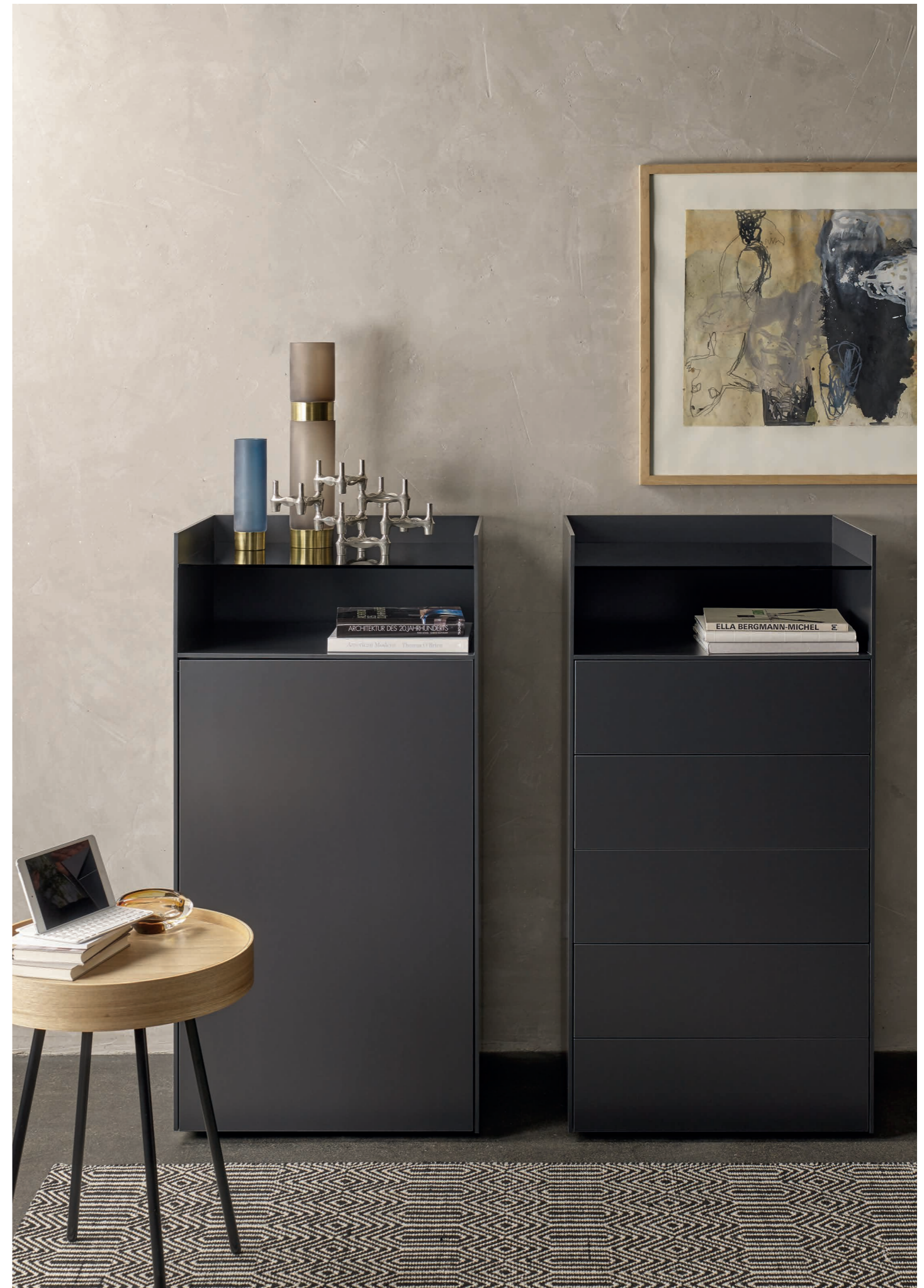
CENTRIC Solitärkommode | Dekor | Graphitschwarz | Links: Mit offenem Fach und Parsolglasboden, 1 Drehtür | Rechts: Mit offenem Fach und Parsolglasboden, 5 Schubkästen CENTRIC Single Cabinets | melamin | graphite black | Left: With open compartment and glass cover panel, 1 swing door | Right: With open compartment and glass cover panel, 5 drawers