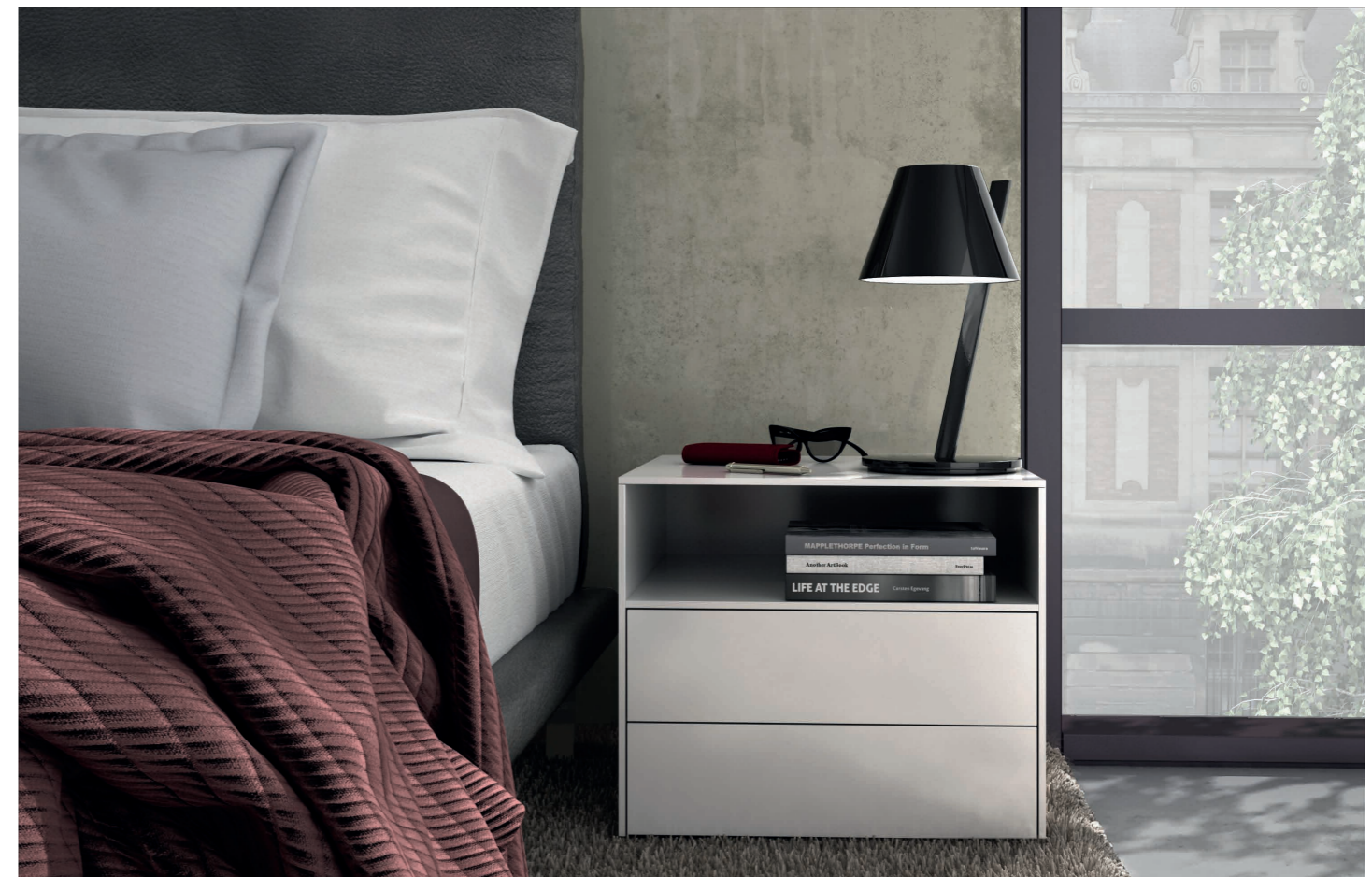
CENTRIC Solitärkommode | Lack weiß RAL 9010 | Mit offenem Fach und 2 Schubkästen CENTRIC Single cabinet | Lacquer white RAL 9010 | With open compartment and 2 drawers

They're every inch as good as their big brothers and sisters. Depending on your choice of colour, they can be classic and discreet, or jazzy and outrageous. Whatever you go for, you can be sure it will be stylish, elegant and attractive.