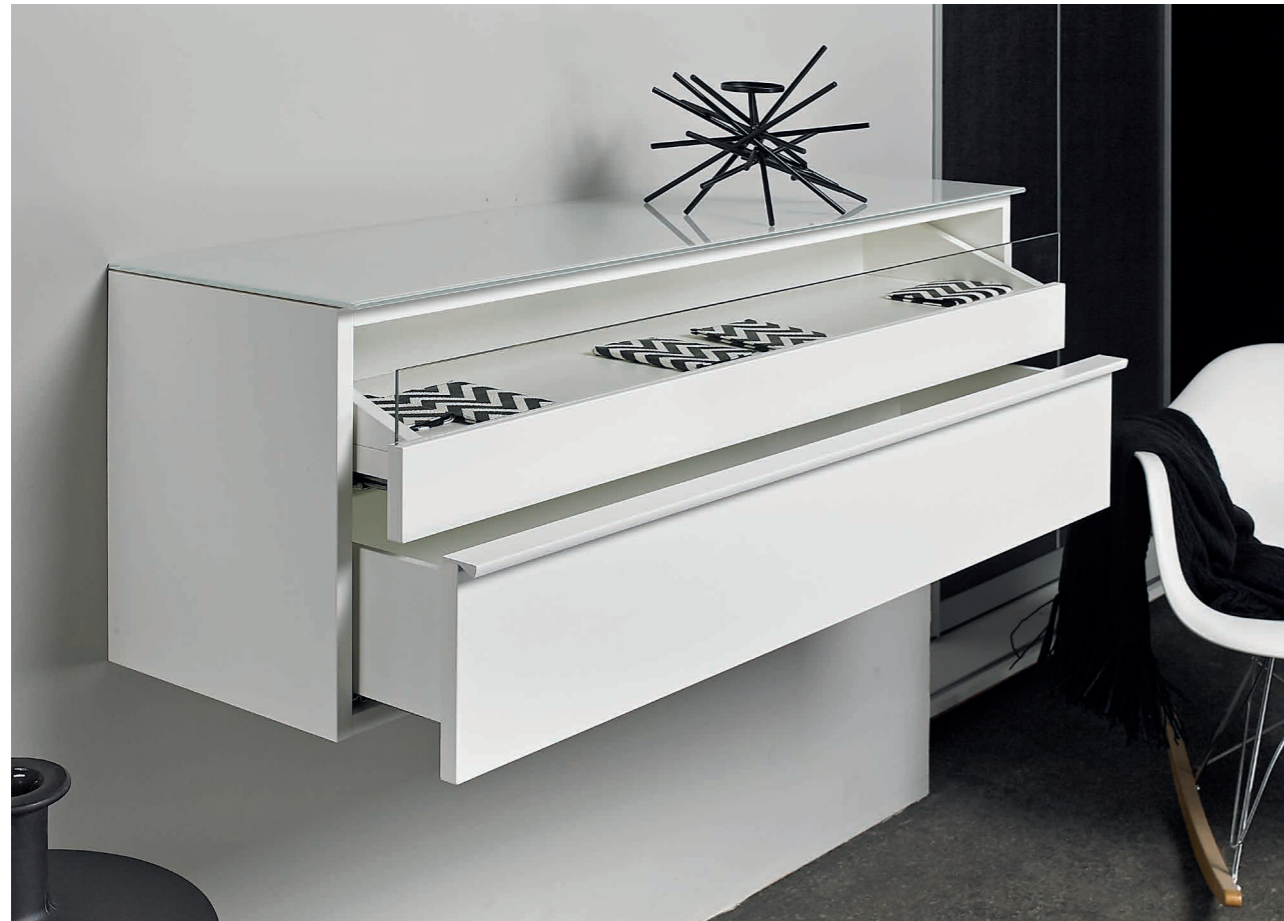
CENTRIC Hängekommode | Lack weiß RAL 9010 | 1 Auszugsboden mit Glasfront, 1 Schubkasten CENTRIC Hanging cabinets | Lacquer white RAL 9010 | 1 pull-out shelf with glass front, 1 drawer

Standing and wall-mounted cabinets are available. Standing cabinets are either placed on a base or fitted with feet. Wall-mounted cabinets are hung on the wall with suitable fittings, making the technology even more effortless.