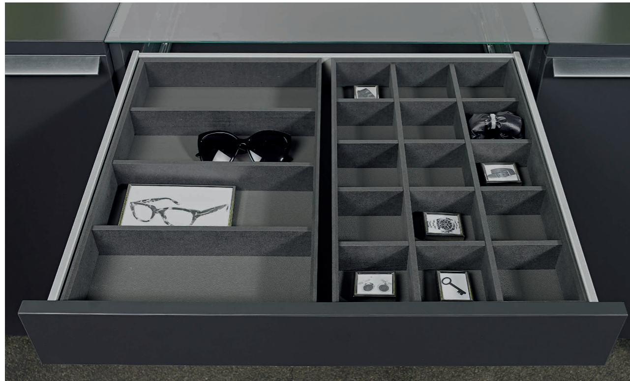
CENTRIC KOMMODE | Schubkasten mit Einsatzrahmen CENTRIC cabinet | drawer with insert frame

Our cabinets lend themselves to almost every room in the house. They look great in a bedroom or living room but are also perfect for hallways. The cabinets give rooms that de-cluttered appearance and can easily store your bits and bobs.